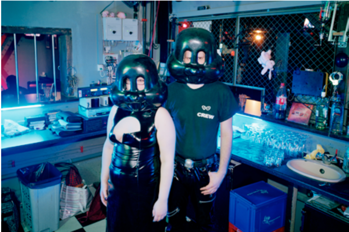
Pleasure Gardens © Reiner Riedler